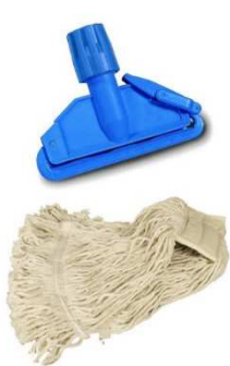
Balai à frange (Type Faubert)